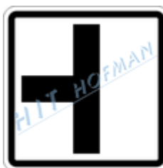
E2a Tvar křižovatky