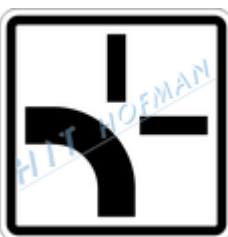
E2b Tvar křižovatky