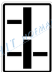
E2d Tvar dvou křižovatek