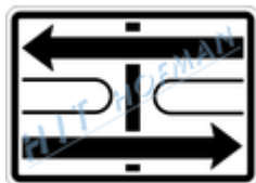
E2c Tvar křižovatky